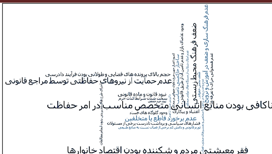
شکل ۲- ابر واژگان مضامین مطرح شده در تحقیق Figure 2. Word cloud of brought of themes in research