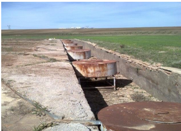
شکل ۱- تصویری از کرت‌های آزمایشی و مخازن جمع‌آوری رواناب و رسوب

تحقیق ۱۲ کرت در قالب سه بلوک برای انجام آزمایش‌ها انتخاب گردید (شکل ۱).