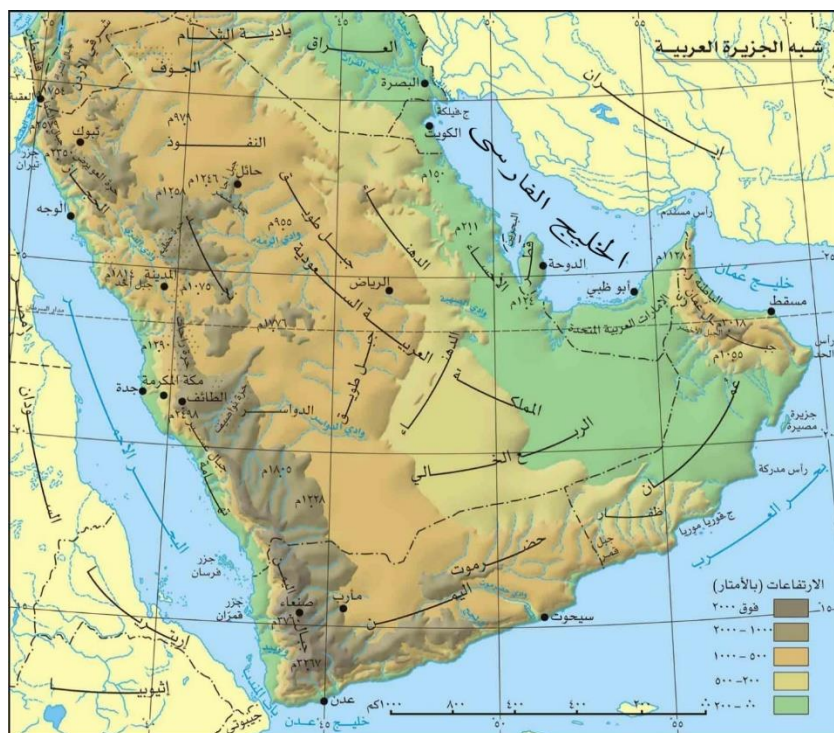
شکل ۳- مناطق و بیابان‌های شبه جزیره