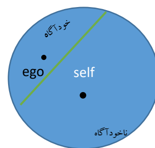
شکل ۱: ساختار دوگانه «خودآگاه، ناخودآگاه» فروید

• شکر ایزد که میان من و او صلح افتاد صوفیان رقص کنان ساغر شکرانه زدند به نظر می‌رسد در این بیت «او» نه وجودی بیرونی بلکه هویتی درونی دارد. ساختاری درون روانی که متفاوت با «من» ماست. لازم به توضیح است که وجود ساختار دوگانه در روان بشری از مدت‌ها قبل برای انسان‌ها شناخته شده بوده‌است و بعد از ارائه ساختار دوگانه «خودآگاه، ناخودآگاه» توسط فروید، فرمولاسیونی عملی و روانکاوانه پیدا کرد. اما کسی که این فرمولاسیون را به دقت توضیح داد کارل گوستاو یونگ بود. شکل ۱ فرمولاسیون یونگ را نشان می‌دهد، از دید یونگ ego یا «من» مرکز روان خودآگاه ماست؛ اما کلیت روان، (اعم از خودآگاه و ناخودآگاه) مرکز دیگری نیز دارد؛ مرکزی که مرکز تمامیت دایره وجود ما را ایجاد می‌کند. این مرکزیت توسط یونگ «خویشتن» (self) نامیده شد.