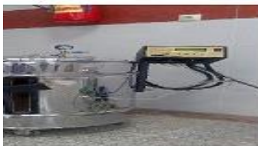
شکل ۱- دستگاه پیرولیز چوب

برای انجام این پژوهش یک نمونه خاک غیر زراعی آهکی فقیر از فسفر از عمق ۳۰-۰ سانتی‌متری تهیه و پس از هوا خشک شدن از الک ۲ میلی‌متری عبور داده شد. برای تهیه بیوچار ضایعات هرس درختان سیب و انگور بعد از جمع-آوری به قطعات کوچک خرد شده و بعد از خشک شدن در آن در دمای ۷۰ درجه سلسیوس، عمل پیرولیز در دمای ۴۰۰ درجه سلسیوس به مدت یک ساعت با گرمادهی آهسته توسط کوره با ارتفاع فضای داخلی ۵۰۰ و قطر ۴۰۰ میلی‌متر و مجهز به سیستم حسگرهای اندازه‌گیری دقیق کنترل دما و فشار انجام گرفت (شکل ۱). مواد بدست آمده از پیرولیز (بیوچار) پودر شده و از الک ۲ میلی‌متری عبور داده شدند و به آزمایشگاه برای مطالعات بعدی منتقل یافتند.